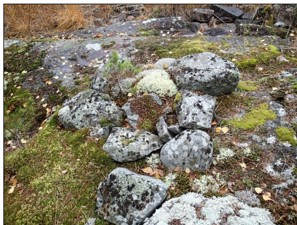
Vasemmalla näkymä rakennelman takaa rannalle. Oikealla rannan tuntumassa oleva pienempi matala latomus.