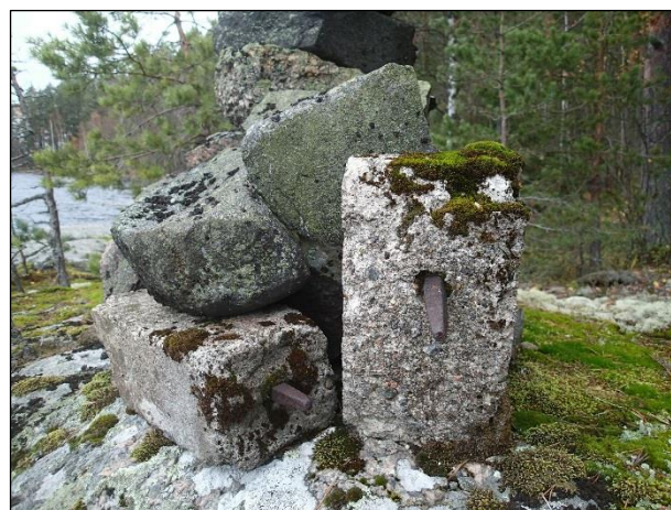
Kuvat nykyaikaisesta latomuksesta, jossa on alimmaisena betonisia palkkeja.