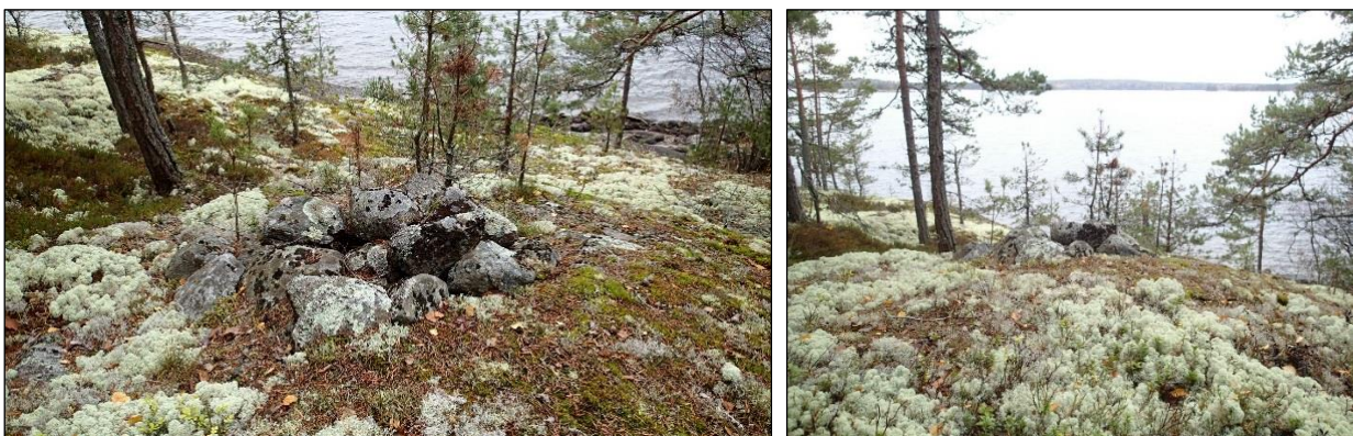
Kallion päälle tehty, osin sammaloitunut matala latomus.

rajamerkiksi. Latomuksen merkitys ei selvinnyt. Kyseinen latomus on kuitenkin selvästi ihmisen tekemä ja vaikuttaa vanhalle. Näillä perusteilla katson kohteen olevan kiinteä muinaisjäänös.