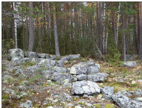
Vasemmalla rakennelma matalan kallion päällä kuvattuna etuviistosta. Oikealla rannan suunnasta.