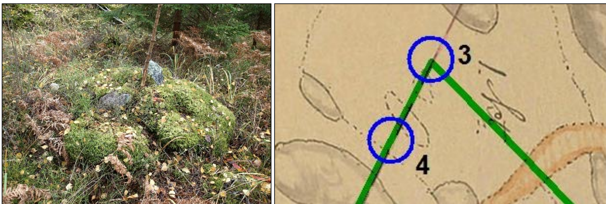
Vasemmalla maastossa oleva rajamerkki, oikealla ote vuosien 1776–1801 kartasta.